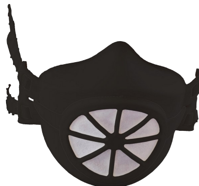
NOIR / noir