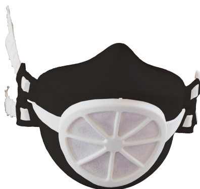
NOIR / blanc