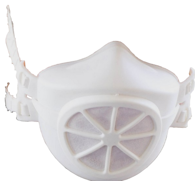
BLANC / blanc