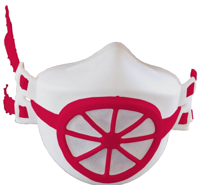
BLANC / rouge