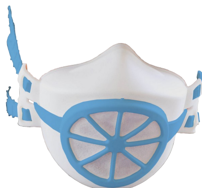
BLANC / bleu clair